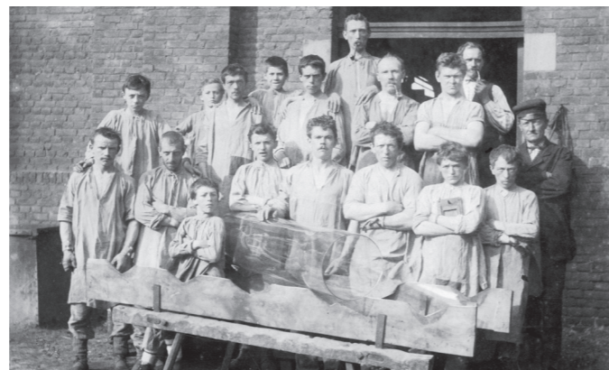
Groupe d'étendeurs, Verreries Bennert et Bivort, Jumet (Belgique), 1882 (Collection particulière).

Image couverture: Porteuses de canons, Verreries de Jumet, c. 1900 (Collection Musée du Verre de Charleroi) Ed. resp.: Christophe Ernotte, Directeur Général f.f.