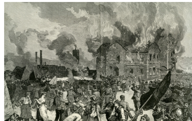
Incendie du Château Baudoux, Jumet (Belgique), 1886