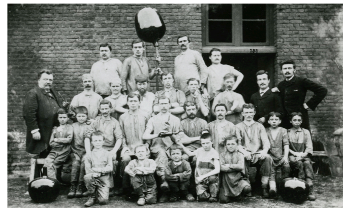
Groupe de souffleurs, région de Charleroi (Belgique), c. 1900.

Tarif: gratuit Réservations au +32(0)71/86.22.65 ou pascal.csik@charleroi.be