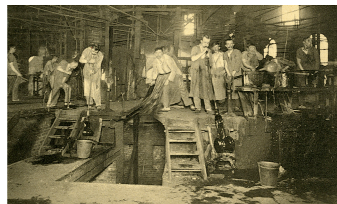
Groupe de souffleurs de verre, région de Charleroi (Belgique), c. 1900.